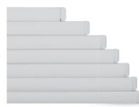
→ Découpe équerre : tolérance des mesures