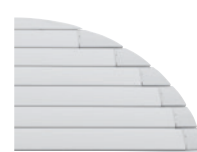
→ Ailettes découpées : rapport qualité / prix