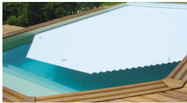
→ Pans coupés